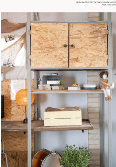
תקופת של סידור. עיצב: שירי פיל ומיכל אגם אליסון.