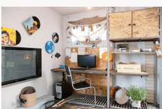
תקופת של סידור. עיצב: שירי פיל ומיכל אגם אליסון. צילום: משה חבקן