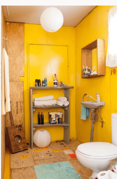
תקופת של סידור. עיצב: שירי פיל ומיכל אגם אליסון.

רצפה לקבר את מבין 'את' למייל? הידעמי ניוטורמט שגנו