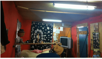
תקופת של סידור יום.

המעצבות שירי פיל ומיכל אגם אליסון שיפצו קרוואן רעוע למיטה, חייל בסירת גולני ומוסיקאי