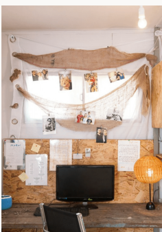
תקופת של סידור. עיצב: שירי פיל ומיכל אגם אליסון.

לא נמצאו תוצאות. נסו לשנות את המילים או הוסיפו סימני חיפוש.